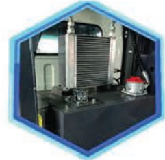
Depósito hidráulico con enfriador