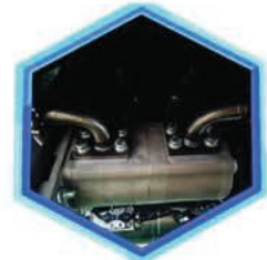
Doble bomba hidráulica