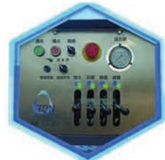
Mandos de escalera