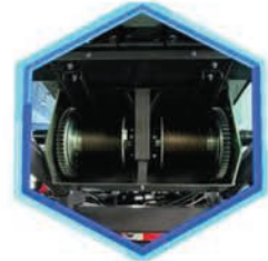
Cabestrante de escaleras doble