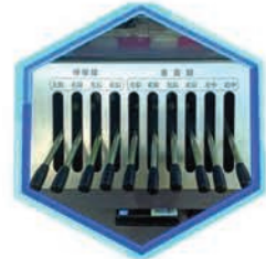
Mandos de estabilizadores